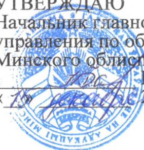
График проведения руководством главного управления по образованию Минского облисполкома «прямых телефонных линий» с гражданами на первый квартал 2026 года