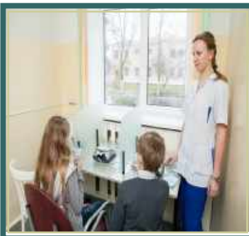
Имеется мини- бассейн.

Один из основных факторов оздоровления обучающихся и формирования у них культуры питания — организация качественного пятиразового питания с использованием современных методик детской диетологии. На пищеблоке работают высококвалифицированные специалисты, используется современное оборудование