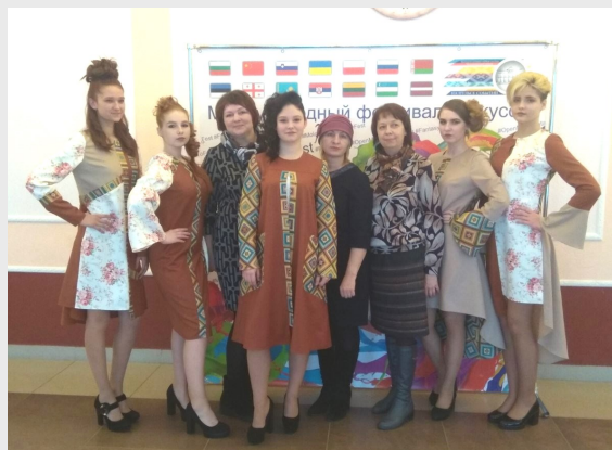
Международный фестиваль искусств "Open MoloFantazy" в номинации "Театр моды. Лучшая коллекция одежды 2022"

2014 год Вилейский государственный колледж